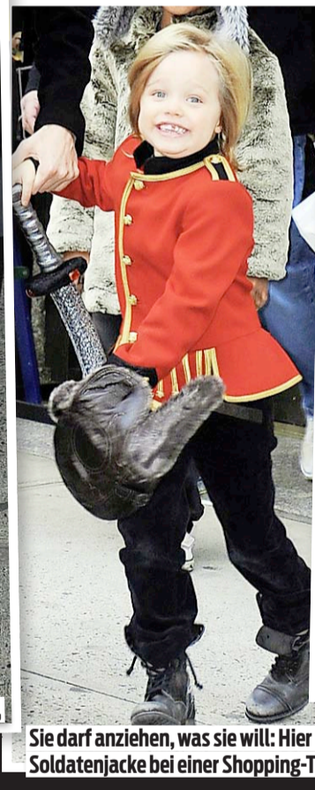
Sie darf anziehen, was sie will: Hier mit Soldatenjackete bei einer Shopping-Tour.