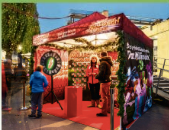
Stimmungsvoll den Advent begehen und beim Bummeln über den Weihnachtsmarkt ein Millionenlos gewinnen.

Das Millionenlos taucht dieses Jahr ins bunte Weihnachtstreiben ein: Mit einem eigenen Stand ist es an diversen Weihnachtsmärkten präsent. An diesem Samstag, 20. und Sonntag, 21. Dezember 2014 bietet sich auf dem Weihnachtsmarkt Muttenz die letzte Gelegenheit: Besu-